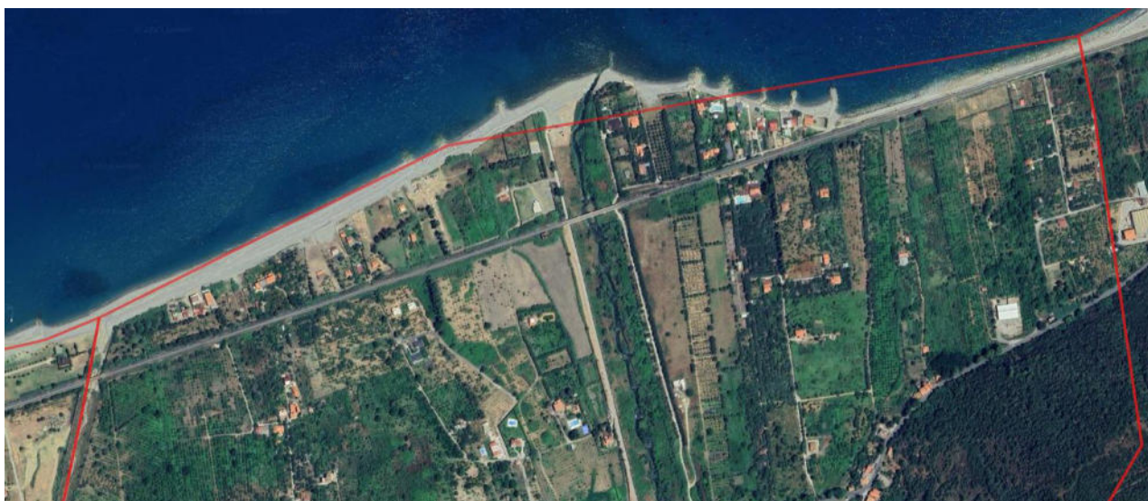
Confine comunale del tratto di spiaggia Ponte Naso

La presenza di tratti di litorale privi di servizi permanenti di assistenza ai bagnanti rende opportuno l'attivazione di un servizio dedicato di vigilanza e salvataggio.