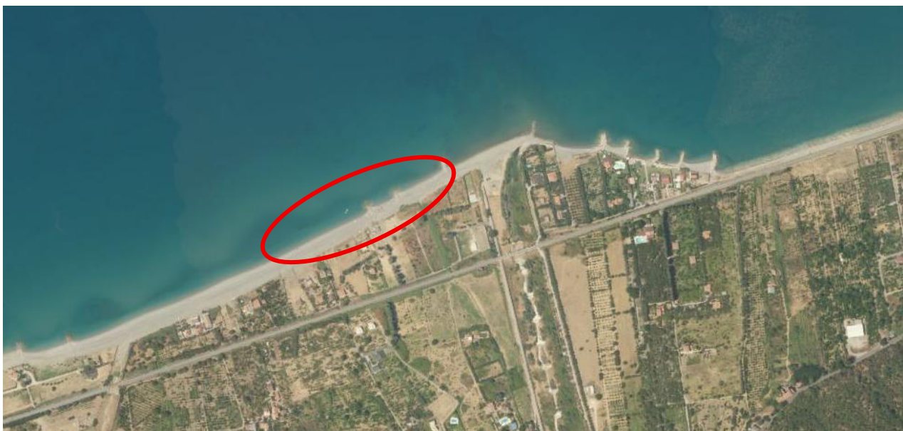
tratto prioritario evidenziato - porzione maggiormente fruita circa 300 m

Le postazioni saranno dotate delle attrezzature e dei dispositivi previsti dalla normativa vigente in materia di sicurezza e primo soccorso.